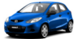
Aurora Blue Metallic 34J