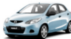
Icy Blue Metallic 33Y