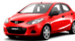
True Red A4A