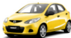
Golden Yellow Metallic 35Y