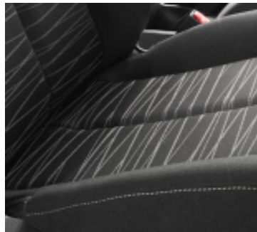
Stoff Schwarz Active