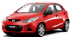
Golden Red Mica 36B