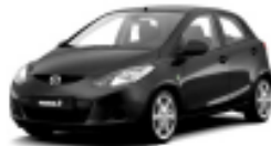
Brilliant Black A3F