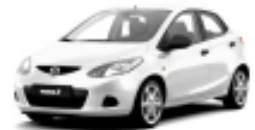
Cristal White Pearl Mica 34K