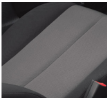
Stoff Schwarz Challenge