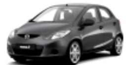
Metropolitan Metallic 36C