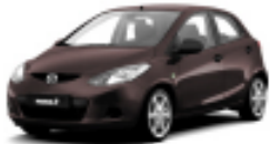
Radiant Ebony Mica 28W