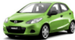
Spirited Green Metallic 36A