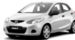
Sunlight Silver Metallic 22V